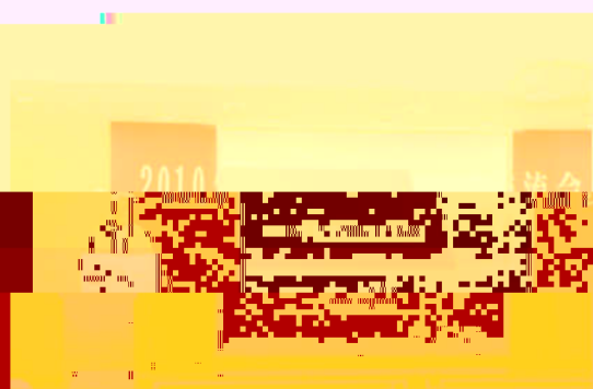
教育学院2010年度学术交流会会场

为深入贯彻落实科学发展观，扎实推进“十二五”规划启动，全面推进“十二五”规划各项任务，为落实“十二五”规划启动，教育学院2010年度学术交流会日前在本院报告厅举行。为落实“十二五”规划启动，教育学院2010年度学术交流会日前在本院报告厅举行。为落实“十二五”规划启动，教育学院2010年度学术交流会日前在本院报告厅举行。